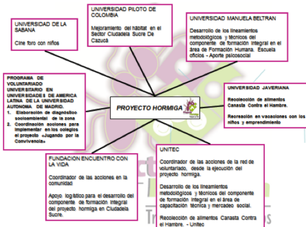
Imagen 1: Cuadro de organizaciones participantes

Estudiantes voluntarios de las distintas universidades participantes