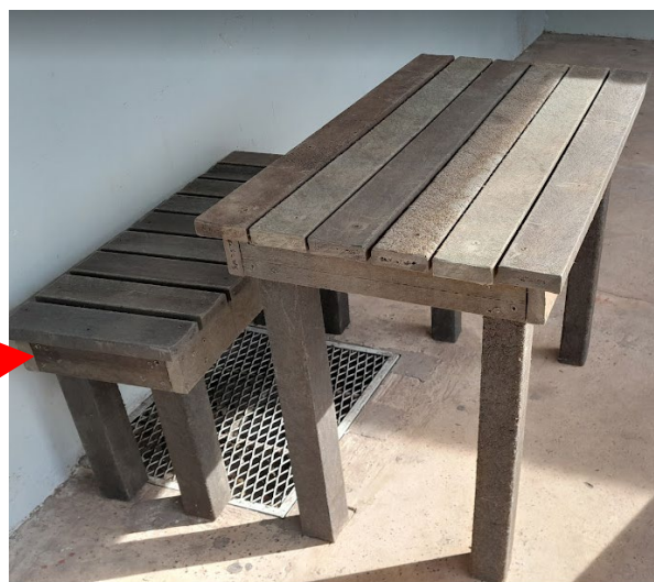
Banco/mesa con material reciclado por escuela