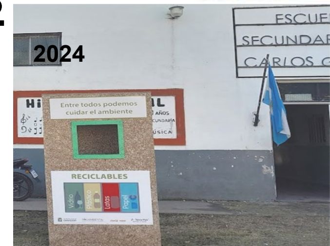
Charla EEST N° 1 -2023